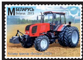
Колавы трактар «Беларус-2422» (Колесный трактор «Беларус-2422»)