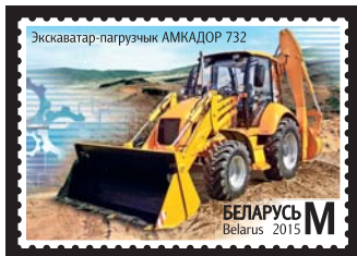
Экскаватар-пагрузчык АМКОДОР 732 (Экскаватор-погрузчик АМКОДОР 732)