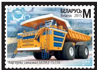
Кар'ерны самазвал БЕЛАЗ-75710 (Карьерный самосвал БЕЛАЗ-75710)