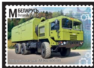
Універсальнае шасі МЗКЦ-600100 (Универсальное шасси МЗКЦ-600100)