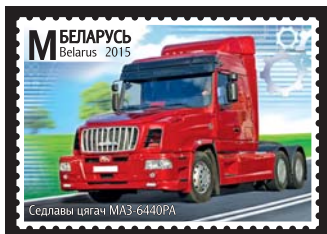
Седлавы цягач МАЗ-6440РА (Седельный тягач МАЗ-6440РА)